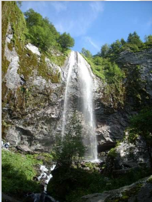
Les cascades du Mont Dore