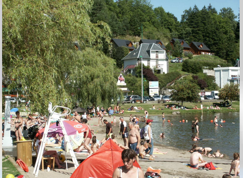
Les lacs pour la baignade