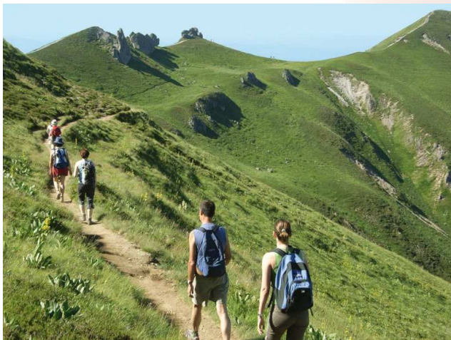
Les nombreuses randonnées