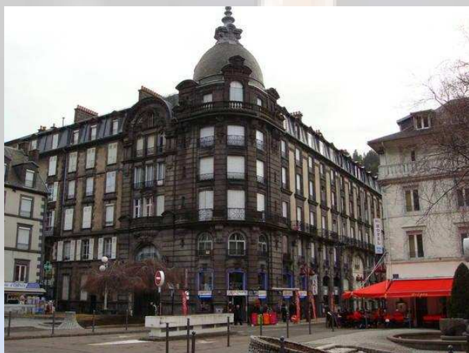
Le Mont dore la ville

Possibilité de passer vos vacances avec vos enfants sur ce site touristique ou bien de vous arranger entre famille de patineurs.